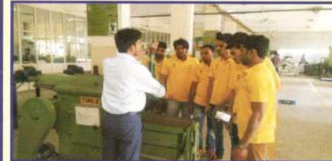
TOOL ROOM SHOP FLOOR